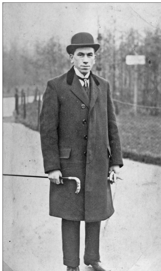
2.1 - Martinus i vinterfrakke og med spadserestok.